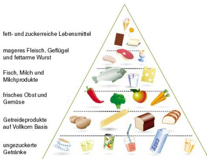
Abbildung 5: Ernährungspyramide

Fazit ist, dass wir von einigen Nahrungsinhalten zu viel, von anderen zu wenig und uns im Durchschnitt zu kalorienreich ernähren, weshalb sich auch immer mehr ernährungsbedingte Krankheiten manifestieren. Eine richtige und ausgewogene Ernährung ist somit ein wesentlicher Baustein in der Behandlung des Diabetes mellitus (Müller, Weißenberger 2009, S.15).