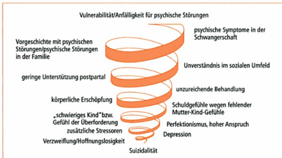
Abb. 1 Depressive Spirale bei postpartalen Depressionen 50

Der Insuffizienztyp führt mit zunehmender Hoffnungslosigkeit immer tiefer in eine depressive Spirale hinein und kann zur Chronifizierung neigen, wenn er unbehandelt bleibt.