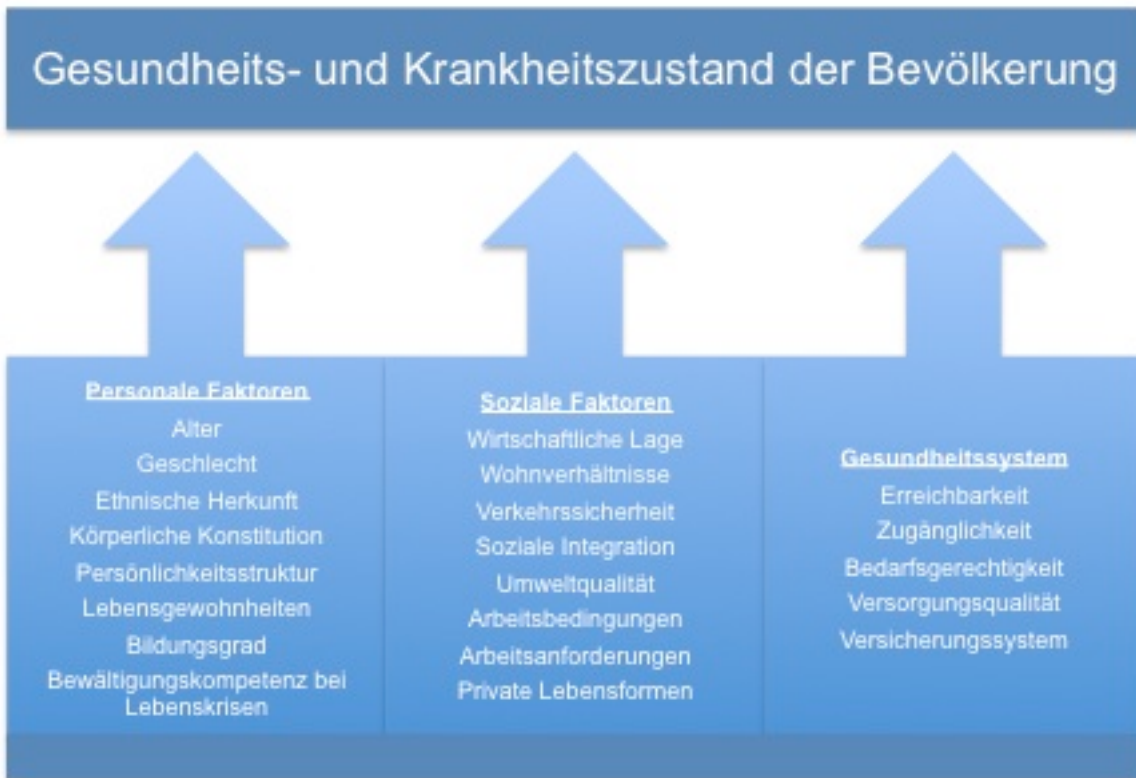
Abbildung 2: Beeinflussende Faktoren

(Eigendarstellung nach Hurrelmann 2003, p. 27)