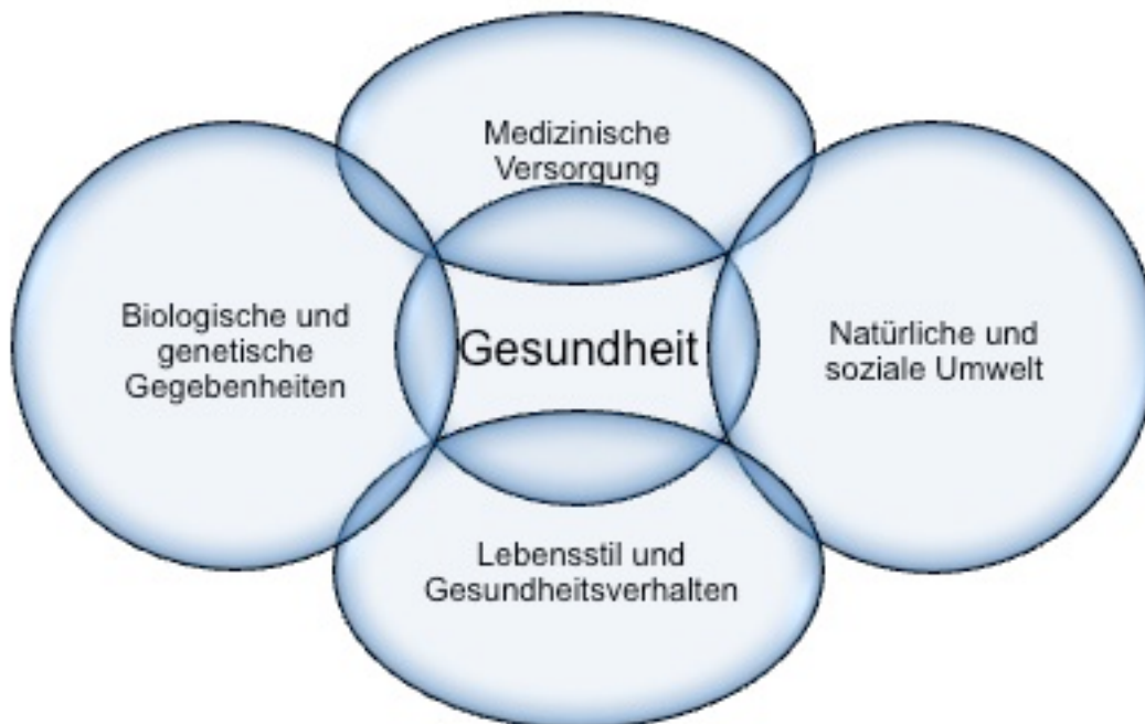
Abbildung 1: Vier Gesundheitsdeterminanten

Vier Determinanten von Gesundheit nehmen nach Gutzwiller & Jeanneret (1999, S.24) aufeinander und auf diesen „dynamischen Prozess“ der Gesundheit Einfluss. Folgende Grafik stellt diese dar: