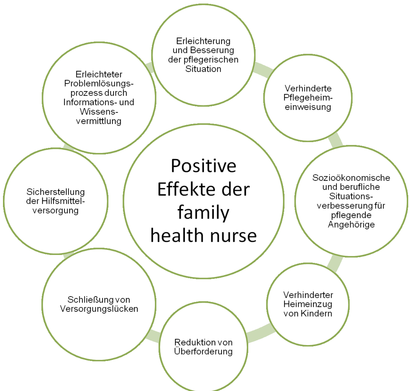
Abbildung 8: Positive Effekte der family health nurse

Im Allgemeinen zeigt die Studie Krüger et al. (2012), dass Versorgungslücken geschlossen und die Betreuung und Begleitung durch die family health nurse insgesamt von den Familien als sehr positiv dargestellt und wahrgenommen wurde.