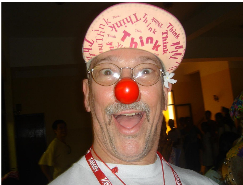
Abb.2: Hunter Adams als Clown

Er war einer der ersten, der mit roter Pappnase, langem, buntem Kittel, Schnurrbart sowie übermäßig großen Schuhen in die Patientenzimmer marschierte um dort seine Späße zu treiben und die Patienten zum Lachen zu bringen. „Patch“ ist gleichermaßen Arzt, Clown und Visionär eines glücklichen Lebens. Humor ist für ihn ein Mittel gegen alle Krankheiten und derzeit sorgt er mit der Errichtung eines Gesundheits-Institutes für Aufsehen. 16