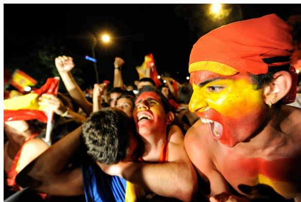
Abb.7: Spanische Fans

„In diesem Fall gibt es keinen Widerstreit zwischen Vernunft und Instinkt, zwischen Geist und Gefühl: der Mensch erlebt sich als eine vollkommene Einheit, er fühlt sich wie in einem Rausch – und er gibt diesem Gefühl lustvoller Kraft und Stärke stets den gleichen kennzeichnenden Ausdruck: er lacht!“ 27