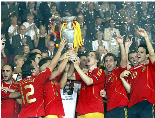
Abb.6: Weltmeister- Spanien

Vergleichen wir diesen Sieg mit einem Sieg bei der Fußball-Weltmeisterschaft. Der Triumph im Finale ist der Traum einer ganzen Nation. Weltmeister zu sein ist das Größte was man erreichen kann. Der Jubel der Spieler, der Fans und des ganzen Landes des Weltmeisters kennt keine Grenzen. Rufen sie sich die Bilder der Fußball-WM ins Gedächtnis. Ähnlich triumphieren die Jäger.