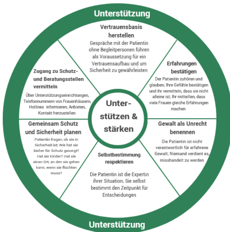
Abbildung 3: Unterstützen und Stärken Rad; erstellt mit Prezi in Anlehnung an das medizinische „Macht und Kontrolle Rad“, bearbeitet von Hellbernd/Wieners (2004)

Das Erkennen, Ansprechen, Dokumentieren und Intervenieren bei häuslicher Gewalt ist Teil ärztlichen Handelns und spielt aufgrund der Schlüsselrolle des Gesundheitswesens eine bedeutende Rolle für einen effektiven Gewaltschutz. Es gibt empfehlenswerte Interventionsleitlinien, an denen sich ärztliches Handeln orientieren kann, beispielsweise das S.I.G.N.A.L Interventionsprogramm, erstellt von Hellbernd et al (2004), sowie der Leitfaden zur gesundheitlichen Versorgung gewaltbetroffener Frauen des BMWFJ (2011).