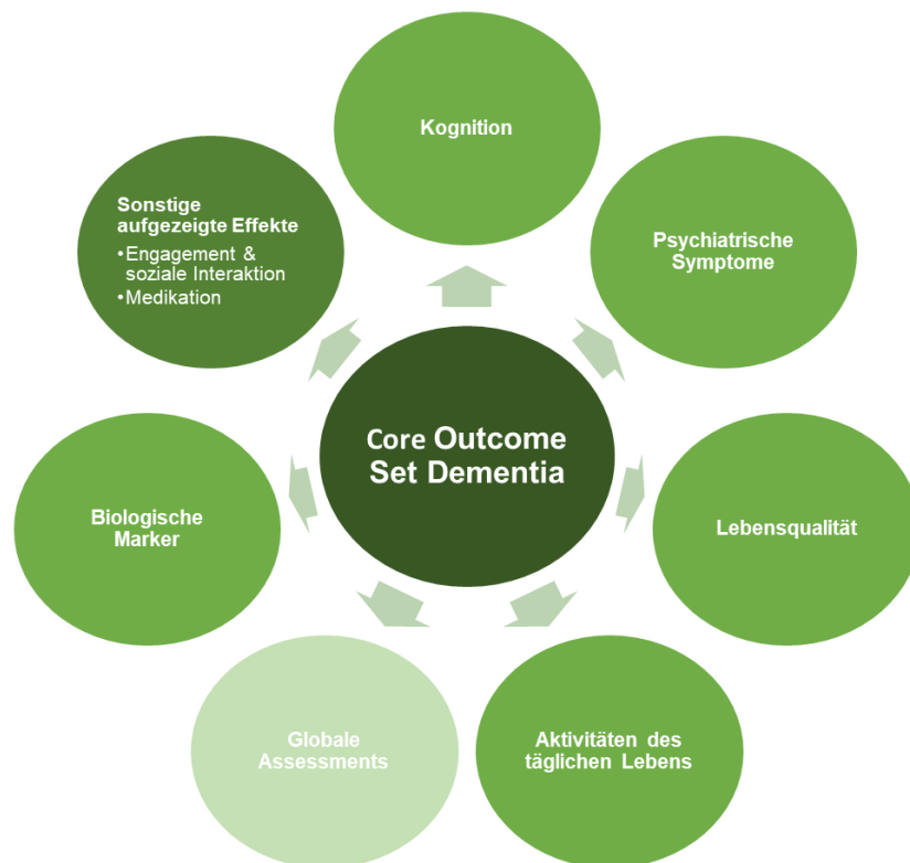
Abbildung 4: Grafische Darstellung jener Core Outcomes, welche in den inkludierten Studien untersucht wurden

In Abbildung 4 werden jene Core Outcomes dargestellt, welche in den inkludierten Studien untersucht wurden.