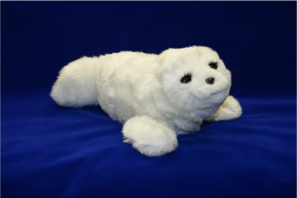
Abbildung 3: PARO der 7. Generation (Credit AIST, Japan); (schriftliche Zustimmung durch Dr. Takanori Shibata (AIST, Japan) erhalten)

PARO wurde insgesamt fünfmal in Studien (Jøranson et al. 2015; Liang et al. 2017; Moyle et al. 2013; Petersen et al. 2017; Pu et al. 2020) als sozialer Roboter verwendet. Einmal wurde Kabochan (Chen et al. 2020) und einmal wurden Hasbro Begleitroboter (Teilnehmer*innen konnten sich aussuchen, ob sie gerne einen Hund oder eine Katze hätten) (Hammarlund et al. 2021) verwendet.