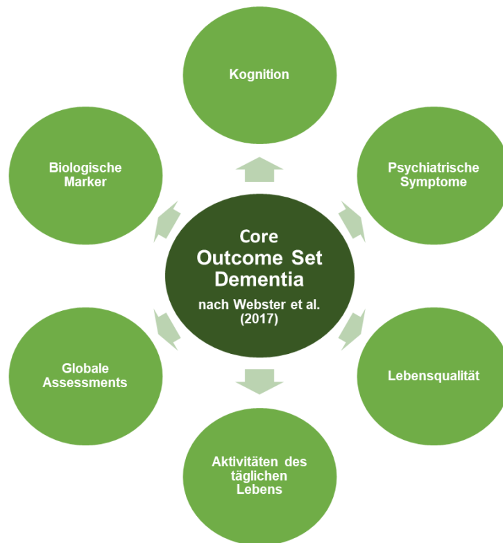
Abbildung 1: Die sechs Core Outcomes nach Webster et al. (2017)

Ein weiteres Symptom der Demenz ist die Depression. Besonders bei älteren Personen zählt die Altersdepression zur häufigsten psychiatrischen Erkrankung, welche jedoch nur bei rund 10% der Betroffenen diagnostiziert und adäquat behandelt wird. Das Problem bei der Stellung der Diagnose ist, dass sich das Krankheitsbild mit anderen, für das Alter typische, Erkrankungen, deckt, wie zum Beispiel der Demenz. Gründe für eine depressive Episode sind oft starke, andauernde Schmerzen, nachlassende Hirn- und Herzleistung oder Bewegungseinschränkungen, welche für sich allein oder in Kombination aus mehreren zu einer verminderten Lebensqualität führen (Rothenhäusler & Täschner 2013; Voderholzer & Pycha 2021a). Die Symptome der Depression ähneln denen bei jungen Personen, mit dem Unterschied, dass diese sich erst langsam, eher schleichend entwickeln und von körperlichen Symptomen überdeckt werden, was dazu führt, dass die Diagnosestellung zusätzlich erschwert wird (Rothenhäusler & Täschner 2013; Voderholzer & Pycha 2021a). Da die Depression ein häufiges Symptom der Krankheit Demenz ist, ist es sehr wichtig, auch ältere Personen mit Demenz zu inkludieren.