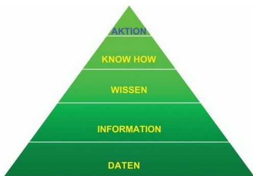
Abb. 4: KHK- Prävention nach Rieder (Dorner, Rieder 2005, S. 15).

Das wissenschaftliche Wissen für die Umsetzung ist vorhanden, nun liegt es an der Praxis. Dies zeigt die Pyramide der KHK- Prävention nach Rieder (Dorner, Rieder 2005, S. 15).